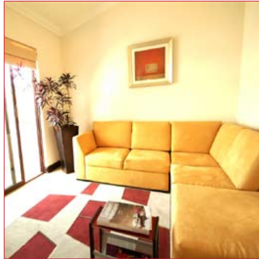
SALA DE TV