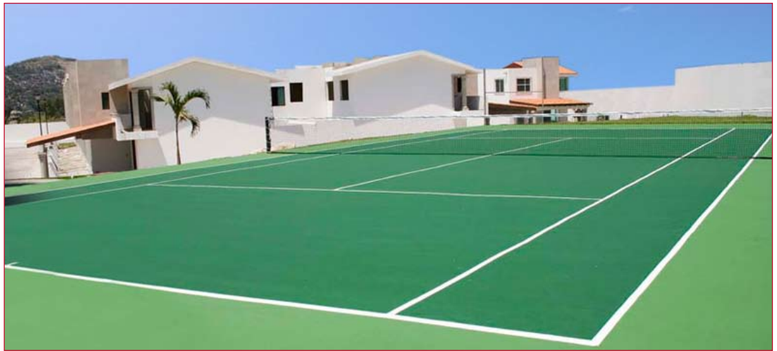
CANCHA DE TENIS